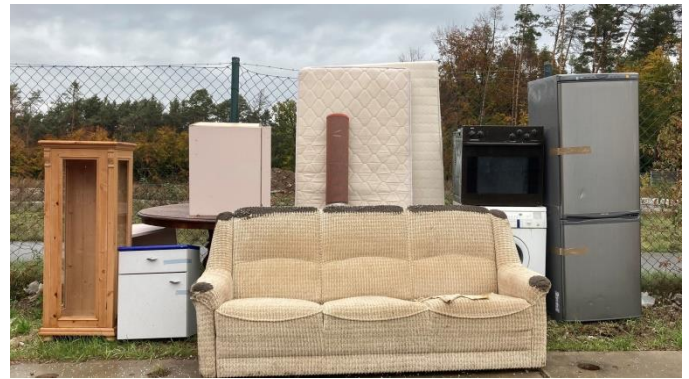
So sieht es aus, wenn der Sperrmüll richtig bereitgestellt wurde.

Entsorgungsfirma Knettenbrech + Gurdulic, Tel. 09321 9394-10, Mo – Mi + Fr 10.00 – 15.00 Uhr, Do 10.00 – 17.00 Uhr, oder Online unter www.kreis-nea.de oder über die Abfall-App des Landkreises