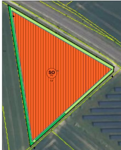
Geltungsbereich für die 1. Änderung des Bebauungsplanes ohne Maßstab