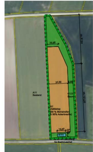
Ausgleichsfläche Altmannshausen, Flurstück 507 ohne Maßstab