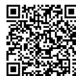
QR-Code - Satzung

Steueramt der Verwaltungsgemeinschaft Scheinfeld, Tel. 09162/9291-2100